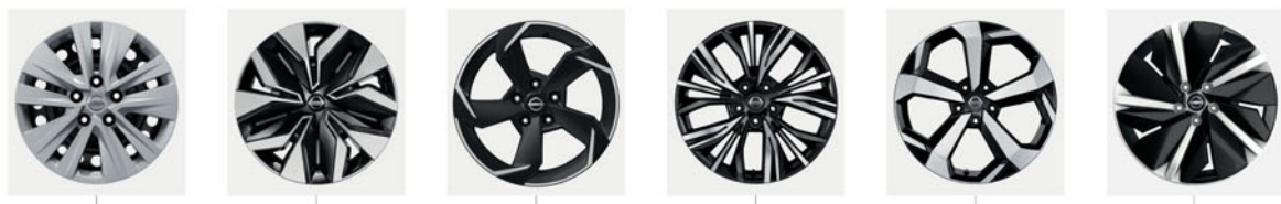
16" DÍSZTÁRCSA (1) 17" FLEXWHEEL DÍSZTÁRCSA 17" KÖNNYŰFÉM KERÉKTÁRCSA 19" AKARI KÖNNYŰFÉM KERÉKTÁRCSA 19" KÖNNYŰFÉM KERÉKTÁRCSA 19" AERO KÉTTONUSÚ KÖNNYŰFÉM KERÉKTÁRCSA (2)